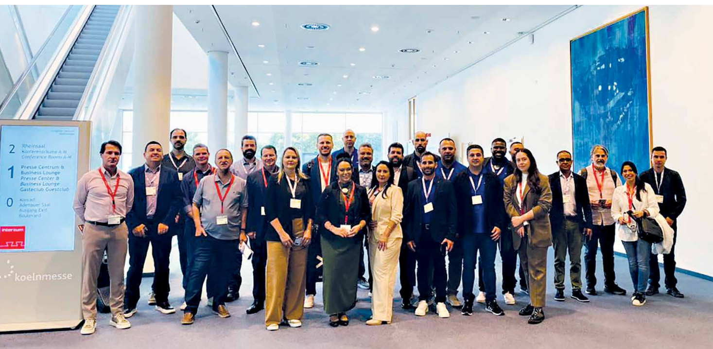
Representantes de mais de 40 fábricas brasileiras de colchões visitaram a Interzum 2025

A ABICOL também marcou presença na ISPA Sustainability Conference, realizada em Atlanta, dias 10 e 11 de setembro, através de seu associado Rene de Oliveira. A ISPA Sustainability é uma iniciativa da International Sleep Products Association (ISPA), focada em educar e promover práticas