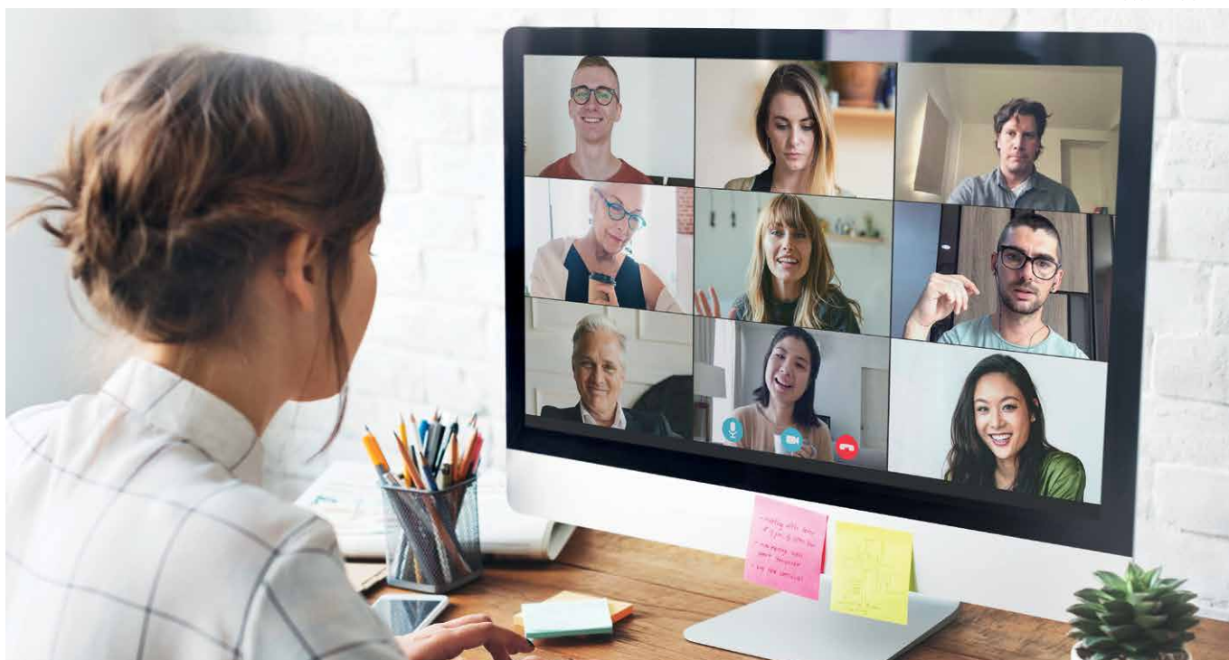
Programa de Boas Práticas em Prevenção de Incêndio visa a prevenção e mitigação de riscos na indústria colchoeira