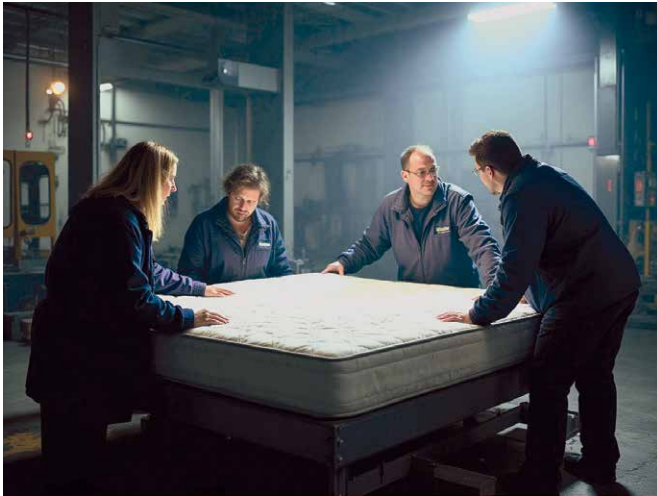
Observatório do Colchão tem como principal função o combate a não conformidade

A vigilância de mercado se consolidou como uma das prioridades da entidade em 2025. A comissão dedicada ao tema intensificou a interlocução com o Inmetro, os IPEMs e demais órgãos responsáveis pela fiscalização. A ABICOL participou de importantes fóruns estratégicos, como o workshop IQ em Foco “Tô de Olho!”, promovido pela CNI, pelo MDIC e pelo Inmetro, destacando a importância da atuação coordenada contra produtos irregulares. Esse esforço, que se alinhou ao reconhecimento do Brasil como líder mundial em processos rigorosos de ensaios obrigatórios de colchões, resultou na criação de materiais educativos voltados ao varejo e ao consumidor, com foco na importância do Selo de Identificação da Conformidade e na rotulagem correta.