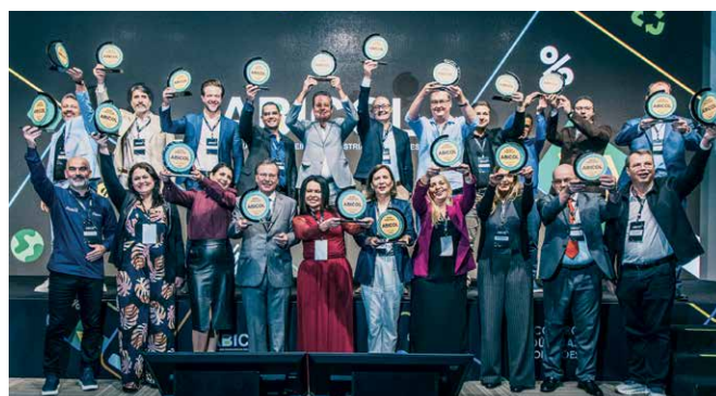
Homenageados com o troféu Boas Práticas ABICOL