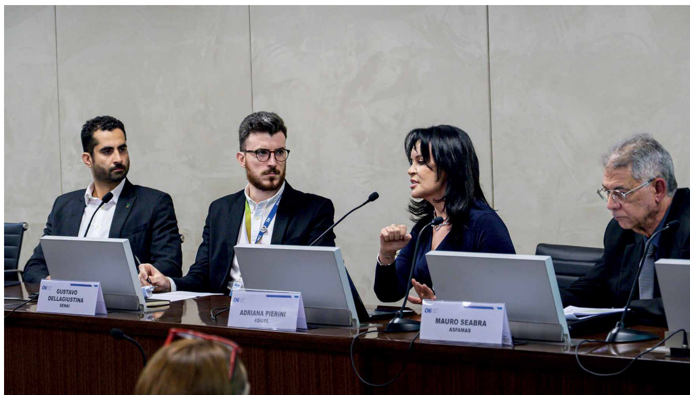
A ABICOL participou de importantes fóruns estratégicos, como o workshop IO em Foco "Tô de Olho!", promovido pela CNI, MDIC e Inmetro

Durante o ano, a ABICOL demonstrou grande capacidade de articulação ao conduzir projetos que combinaram rigor técnico, apoio ao setor produtivo e transparência para consumidores e varejistas. Os principais movimentos realizados indicam as bases para a atuação da entidade em 2026.