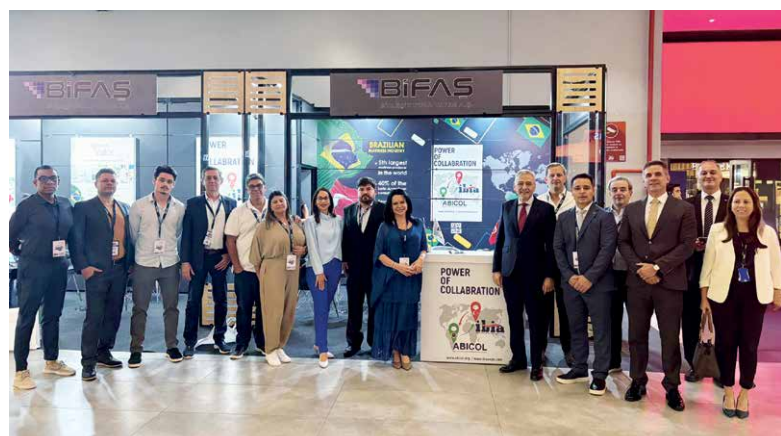
Parte da delegação de brasileiros no estande da ABICOL na Ibia Expo