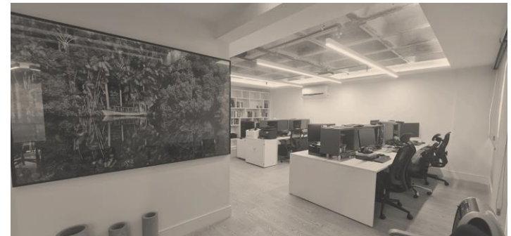
Escritório da UNO em São Paulo